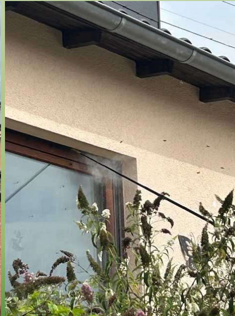
Akteure des Netzwerkes-velutina-saar mit spezieller Spritzstange